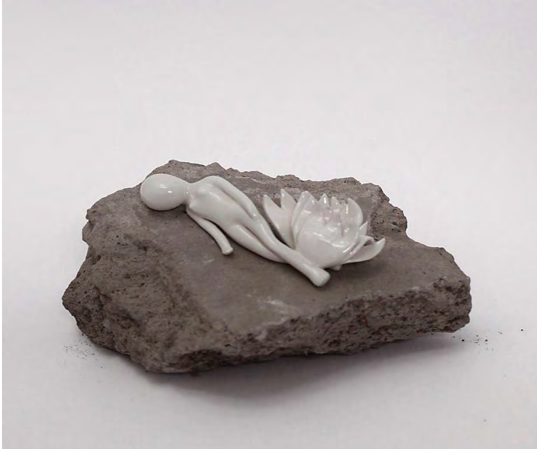
María Allemand Versión VI. Caída , 2020 Cerámica esmaltada y bloque de cemento 12 x 14 x 15 cm 1/3 + PA