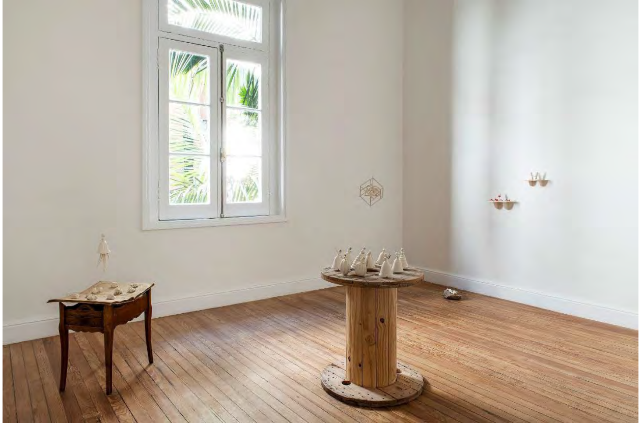
María Allemand VII versiones de un pequeño drama, 2020 Vistas de la sala